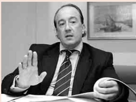
El presidente del Icjce, Rafael Cámara.